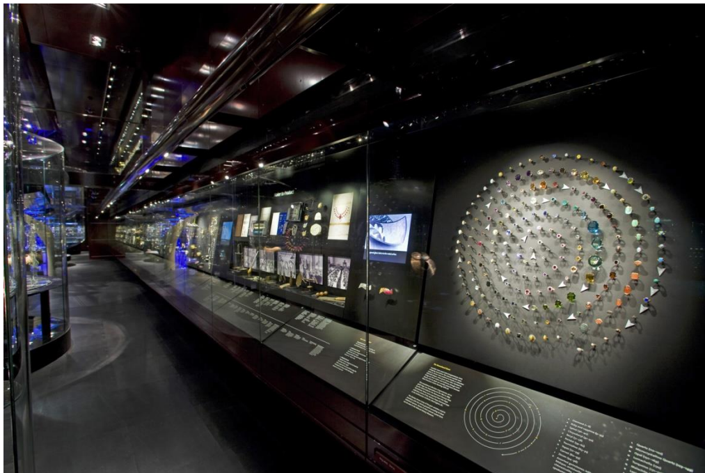
شکل ۳. نحوه نمایش و چیدمان صحیح نمونه‌ها. نحوه نمایش و چیدمان صحیح نمونه‌ها و نورپردازی استاندارد برای بروز بیشترین جلوه بصری در کنار توضیحات مندرج برای هر نمونه، بخش جواهرات موزه A&V.