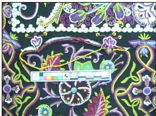
شکل ۲۲- تثبیت نخ های ابریشم