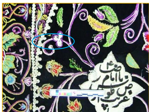
شکل ۵- بالا راست:نمایی از آسیب‌ها و مرمت نا مناسب