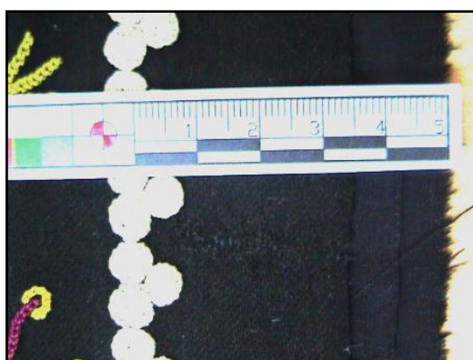
شکل ۱۸- مرمت با روش تثبیت الیاف

۵. ترمیم پارگی‌ها با استفاده از شیوه تثبیت الیاف: پارگی‌هایی که در آن‌ها تار یا پود دچار آسیب شده و از بین رفته با عبور تار یا پود ترمیم شدند. (شکل ۱۷ و ۱۸)