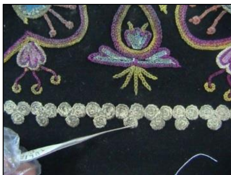
شکل ۲۴- برداشتن جرم ها از روی دوره پوش با ابزار

۹. لکه بری لکه های برجسته: لکه های برجسته ای که بر روی اثر وجود داشت با وسیله ای دارای نوک مدور و غیر تیز که به الیاف آسیب نرساند، برداشته شد. (شکل ۲۴)