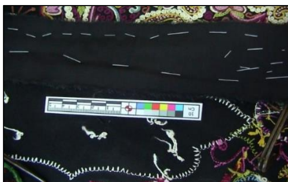
شکل ۲۳- استحکام بخشی اطراف دوره پوش

۱۰. لکه بری بخشی از لکه سراسری اثر به شیوه مکانیکی: لکه هایی که در سراسر اثر بدلیل تماس مداوم دست بوجود آمده بود با وسیله ای دارای نوک مدور و غیر تیز که به الیاف آسیب نرساند برداشته شد. (تصاویر ۲۵-۲۶)