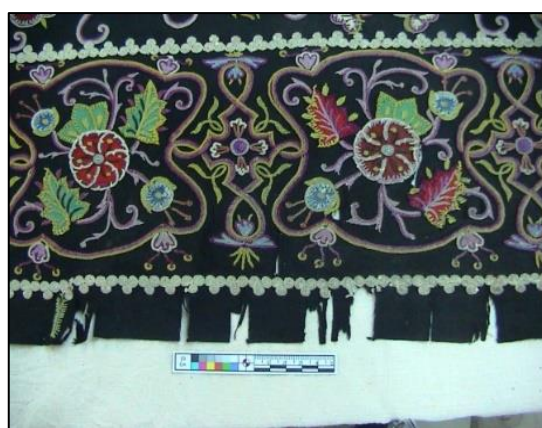
شکل ۱۵- نمایی از آسیب‌های حاشیه دوره پوش

۵. ترمیم پارگی‌ها با استفاده از شیوه تثبیت الیاف: پارگی‌هایی که در آن‌ها تار یا پود دچار آسیب شده و از بین رفته با عبور تار یا پود ترمیم شدند. (شکل ۱۷ و ۱۸)