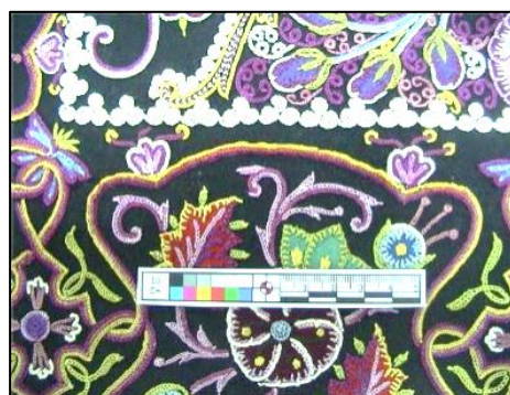
شکل ۲۱- از هم گسیختگی نخ های ابریشمی

۸. استحکام بخشی ۳ طرف اثر: حاشیه بالا و دو حاشیه کناری با گذاشتن پارچه ساپورت و دوخت زدن استحکام بخشی شد تا اتصال قزن ها و دکمه های دوره پوش فشار کمتری به اثر وارد آورد. (شکل ۲۳)