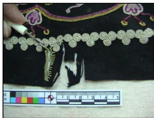
شکل ۱۳- قبل از مرمت