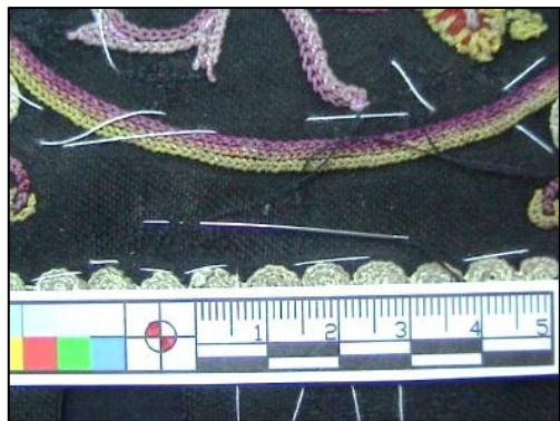
شکل ۲۰- نمای تثبیت ساییدگی