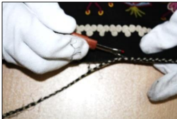
شکل ۲- بازنمودن قیطان