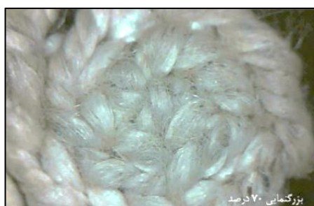
شکل ۲۸- پس از برداشتن آلودگی ها