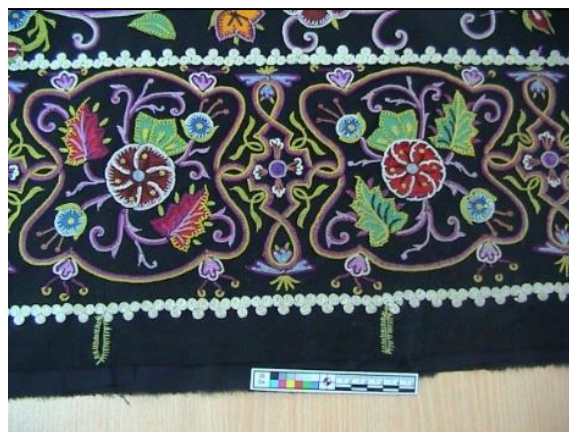
شکل ۱۶- بعد از مرمت