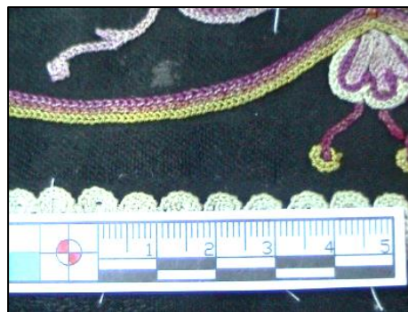
شکل ۱۹- نمای از ساییدگی ها