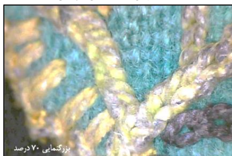
شکل ۳۰- نمای پس از لکه برداری