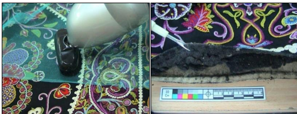
شکل ۳- پرزهای موجود بین آستر و دوره پوش