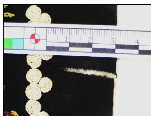
شکل ۱۷- نمایی از هم گسیختگی تار و پور

۶. تثبیت ساییدگی‌ها: در قسمت‌های زیادی از دوره پوش، بدلیل نوع کاربرد آن و تماس دست، رویه ماهوت دچار ساییدگی شده بود و با گذاشتن پارچه ای به‌عنوان ساپرت و دوخته‌ای مناسب ساییدگی‌ها تثبیت شدند (اشکال ۱۹-۲۰)