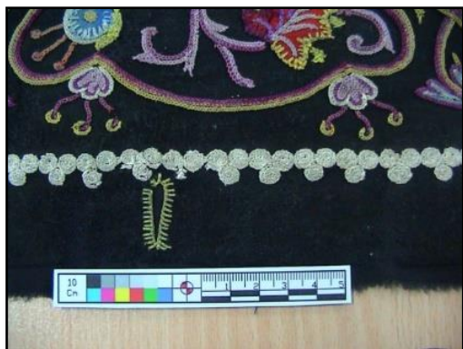
شکل ۱۴- ترمیم پارگی به شیوه رفو