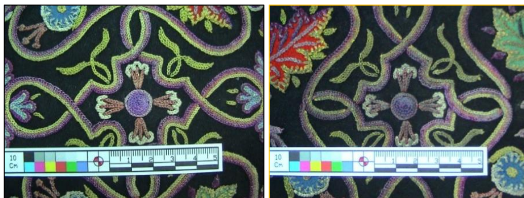
شکل ۲۵- لکه حاصل از تماس دست، قبل از لکه برداری شکل ۲۶- پس از لکه برداری ۱۱. تهیه عکس هایی با بزرگنمایی زیاد از آلودگی های اثر و الیاف: با استفاده از ذره بین دیجیتال تصاویری با بزرگنمایی ۷۰ درصد از الیاف ماهوت زمینه، لکه های اثر قبل و بعد از لکه برداری تهیه شد. (تصاویر ۲۷-۳۰)