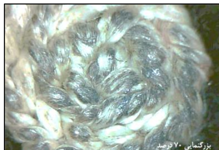
شکل ۲۷- نمایی از لکه های اثر