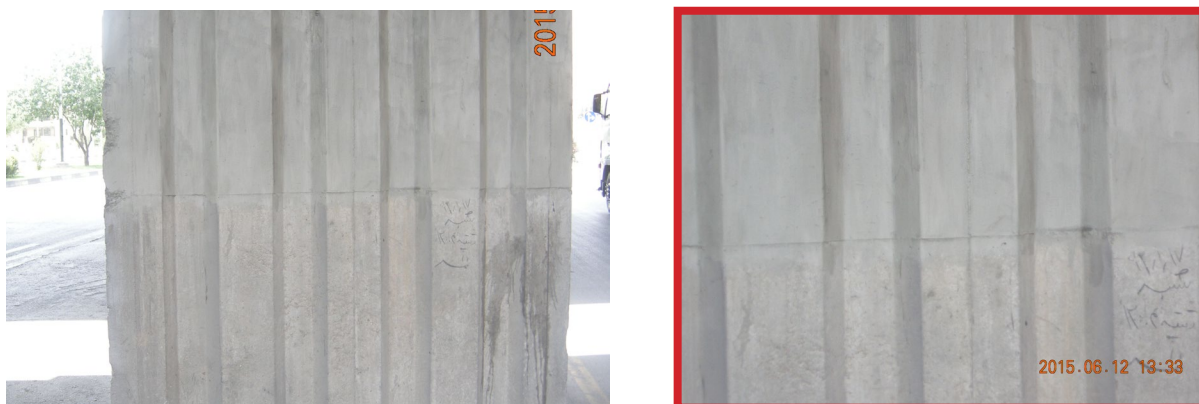
شکل ۳. اجرای پوشش مقاوم سیمانی ضدآب بر روی سطح بتنی (محدوده کادر قرمز رنگ تصویر سمت چپ) بزرگ‌نمایی مرز بین پوشش مقاوم سیمانی ضدآب و سطح بتن طبیعی (تصویر سمت راست)

استفاده از سیمان به‌عنوان بستر اصلی، باهدف افزایش سازگاری و امکان ترکیب با نانو مواد و افزودنی‌های دیگر، مبنای دستیابی به محصول نهایی تحت عنوان پوشش مقاوم سیمانی ضدآب قرار گرفته است (مشکین فام فرد، ۱۳۹۳). دسترسی به تجهیزات تولید و مواد اولیه در داخل کشور ایران، زمینه‌ساز توسعه این فناوری بوده و فرایند تولید از مرحله تهیه مواد اولیه تا عرضه محصول نهایی تحت کنترل دقیق کیفیت آزمایشگاهی انجام می‌گیرد. محصول نهایی به‌صورت خمیر آماده مصرف ارائه شده و در بسته‌بندی‌های سطل‌های ۱۰ کیلوگرمی با ماندگاری دوماهه عرضه می‌شود. هر واحد بسته‌بندی قابلیت پوشش‌دهی حدود ۱۰ مترمربع سطح صاف را داراست.