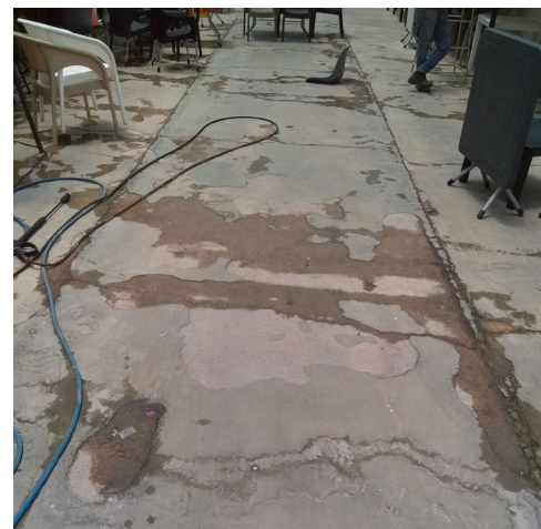
شکل ۵. اجرای پوشش مقاوم سیمانی ضد آب بر روی سطح بتنی افقی، تصویر سمت راست قبل از اجرا و تصویر سمت چپ بعد از اجرا Figure 5. Application of Water-Resistant Cement Plaster on a horizontal concrete surface (right: before application, left: after application)