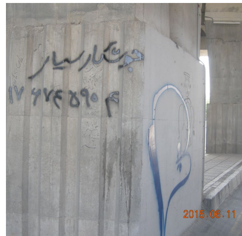
شکل ۴. اجرای پوشش مقاوم سیمانی ضد آب بر روی سطح بتنی عمودی، تصویر سمت راست قبل از اجرا و تصویر سمت چپ بعد از اجرا Figure 4. Application of Water-Resistant Cement Plaster on a vertical concrete surface (right: before application, left: after application)