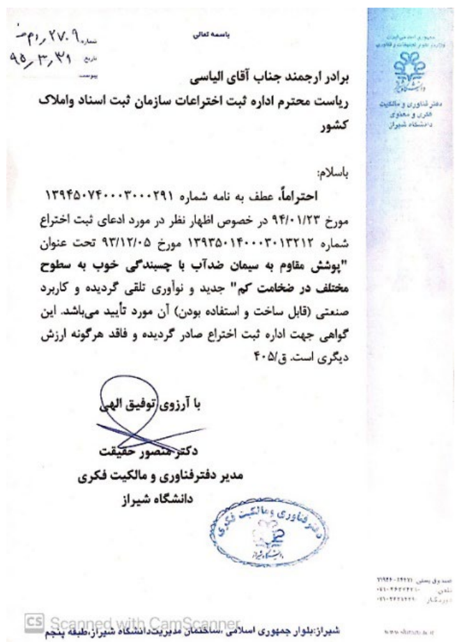
شکل ۲. تأییدیه طرح از دانشگاه شیراز Figure 2. Project Approval by Shiraz University